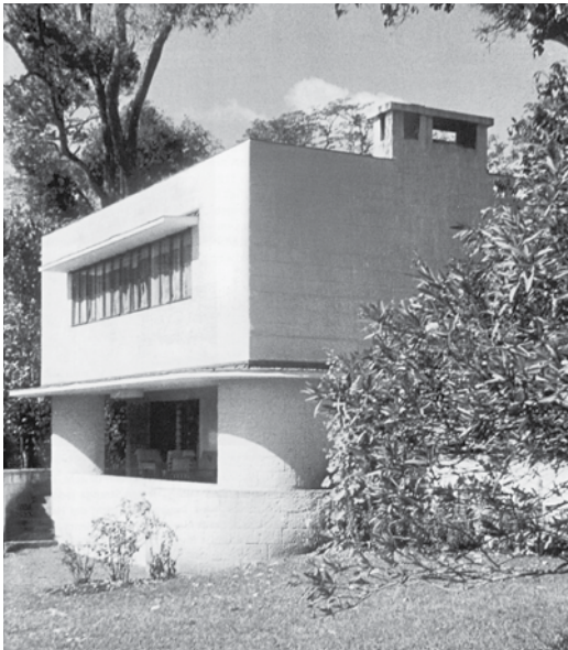
Ernst May: Haus May, Karen bei Nairobi, 1938, Foto: May, DAM, Frankfurt/Main